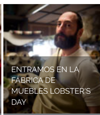
ENTRAMOS EN LA FÁBRICA DE MUEBLES LOBSTER'S DAY