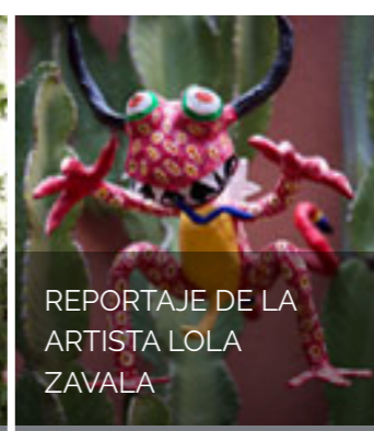
REPORTAJE DE LA ARTISTA LOLA ZAVALA